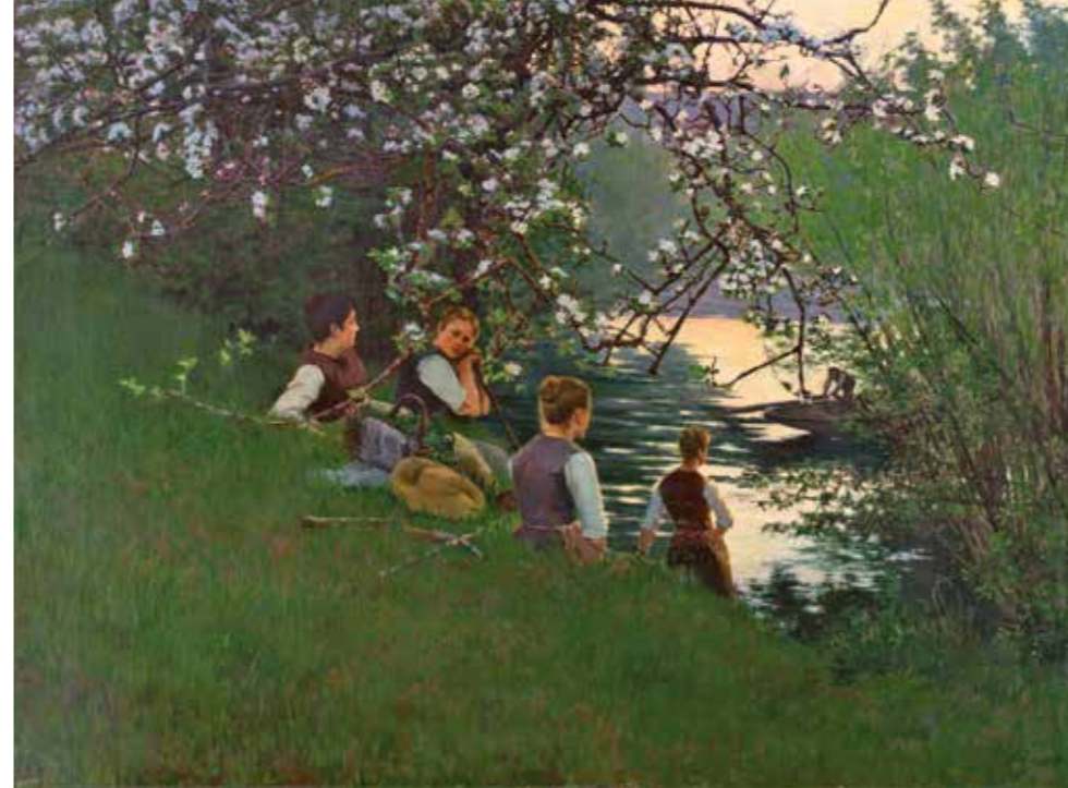
AU PASSAGE DE L'ÎLE DE FRENEUSE, 1895, HUILE SUR TOILE, 74,8 X 100 CM, MUSÉE DU MONASTÈRE ROYAL DE BROU, BOURG-EN-BRESSE