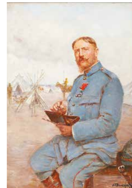
AUTOPORTRAIT, HUILE SUR BOIS, 33 X 24 CM, MUSÉE DU NOYONNAIS, NOYON.