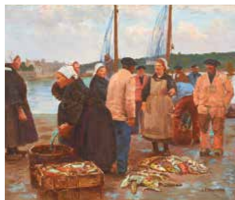
LA CRIÉE - AUDIERNE, VERS 1930, HUILE SUR TOILE, 38 X 46 CM, MUSÉE DES BEAUX-ARTS, VANNES.