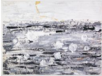
Sapelier Sans titre 20 janvier 1966 Gouache sur papier 49,8 x 66,8 cm N°0924 CEE - MAHSA, Musée d'Art et d'Histoire de l'Hôpital Sainte-Anne ©Dominique Baliko