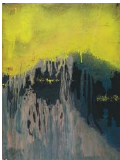
Toubal Sans titre 27 octobre 1967 Gouache sur papier 66,3 x 49,5 cm N°1260 CEE - MAHSA, Musée d'Art et d'Histoire de l'Hôpital Sainte-Anne

Pour tout visuel HD, merci d'adresser votre demande à communication@musee-mahhsa.com