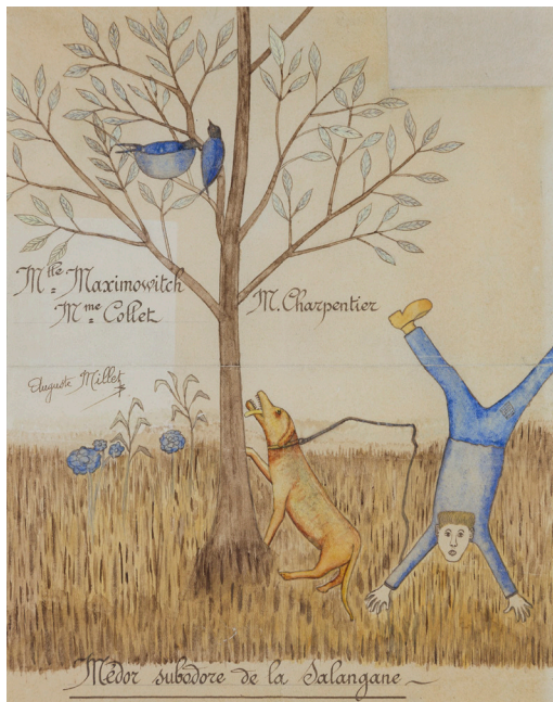
Auguste Millet Médor Subodore de la Salangane [sic] 1928 Aquarelle et encre sur papier 26,6 x 20,8 cm Inv. n°0008

La Collection Sainte-Anne proposera un dialogue inédit avec des oeuvres de la Collection Prinzhorn à Heidelberg (Allemagne) sur la thématique du "drôle" dans la peinture. Cette exposition séjournera ensuite plusieurs mois dans les murs de la Collection Prinzhorn à Heidelberg. Ces deux expositions coproduites questionneront la subjectivité de l'humour et ses différentes formes exprimées dans la création artistique.