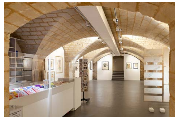
Vue intérieure du Musée, salle d'exposition, ©CEE-MAHSA ©Dominique Baliko