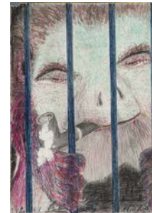
5. Alois Marty Sans titre [Singe fumant derrière les barreaux] 7.9.1969 Stylo feutre, stylo à bille, crayon, crayon de couleur sur papier 29,7 x 21,2 cm Sammlung Prinzhorn, Inv. n° 8404/15 (2011)