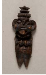
1. Johann Karl Genzel [Pseudonyme Brendel] „Hindenburg“ vers 1914/1918 Bois teinté 15,5 x 6,2 x 3,5 cm Sammlung Prinzhorn Inv. n° 120