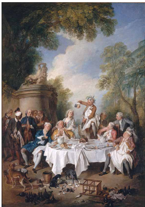
Nicolas Lancret (1690-1743), Le Déjeuner de jambon , huile sur toile, commandé en 1735 par le roi Louis XV pour sa salle à manger, dite « des retours de chasse », à Versailles. Chantilly, musée Condé.