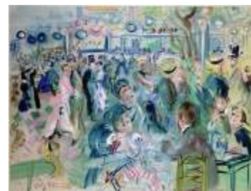
Le Moulin de la Galette , 1939 Aquarelle et gouache sur papier vélin d'Arches, dim. 50 cm x 65,5 cm Paris, Musée d'art Moderne de la ville de Paris, legs de Mme Berthe Reysz, 1975 © Adagp, Paris 2021