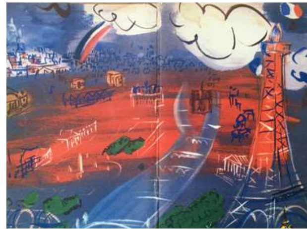
Paris, où, quand, comment, 1954, 16,5 × 11cm, Guide de tourisme de Paris imprimé par le Comité de tourisme de Paris