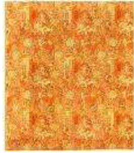
Bagatelle ou Le Pré Catelan (numéro de patron B. F. 14978) , 1919 Satin de 8, chaîne (décochement 3), 2 lats de liseré à effet damassé. Soie et schappe. Lyon, musée des Tissus, Don Bianchini-Férier, 1923 © Adagp, Paris 2021