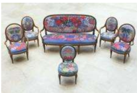
Raoul Dufy et André Groult (1884-1966), Ensemble de mobilier avec les monuments de Paris (les Tuileries, la République, l'Opéra et les Champs-Élysées, l'Arc de triomphe), Bois de hêtre, tapisserie de Beauvais, 1933, Paris, Mobilier national et manufactures des Gobelins, de Beauvais et de la Savonnerie