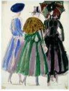
Robe de la maison Poiret , 1920 Gouache sur papier, dim. 32,6 cm x 25 cm Musée national d'art moderne, Centre Georges Pompidou, legs de Mme Raoul Dufy, 1963, © Adagp, Paris 2021