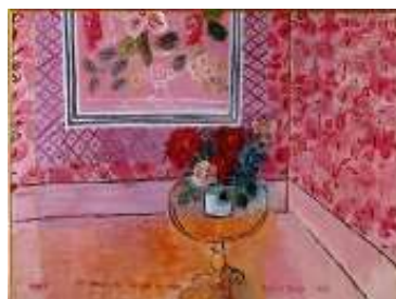
30 ans ou la vie en rose , titre attribué : 1901, 30 ans ou la vie en rose Huile sur toile, dim. 98 cm x 128 cm Paris, Musée d'art Moderne de Paris, donation de Mme Mathilde Amos, 1955 © Adagp, Paris 2021