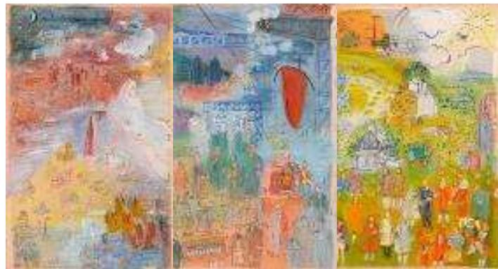
La Fée Electricité , 1952-1953