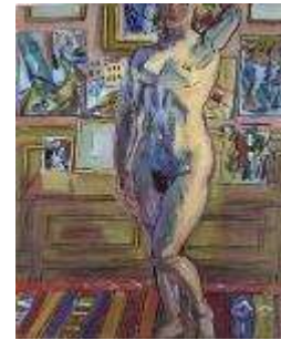
Atelier de Paris avec nu , 1944 Huile sur toile, dim. 45,8 cm x 37,9 cm Bordeaux, Musée des Beaux-Arts de Bordeaux, dépôt du musée national d'art moderne, Centre Georges Pompidou, legs de Mme Raoul Dufy, 1963