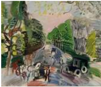
Au bois de Boulogne , 1920 Huile sur toile, dim. 46 cm x 55 cm Paris, Musée d'art Moderne de Paris, donation de Henry-Thomas, 1976 © Adagp, Paris 2021