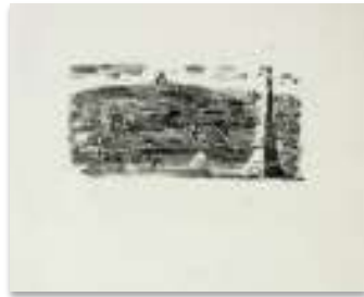
Le Poète Assassiné , 1926 Xylographie, dim. 29 cm x 23 cm. Nice, musée des Beaux-Arts Jules Chéret, dépôt du musée national d'art moderne, Centre Georges Pompidou, © Adagp, Paris 2021