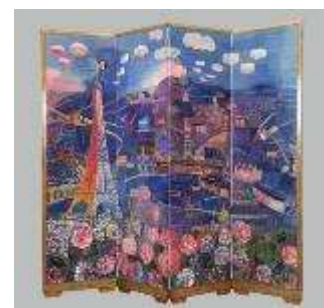
Raoul Dufy et André Groult (1884 - 1966) Panorama de Paris, 1933 Bois de hêtre, tapisserie de Beauvais, dim. 227 cm x 264 cm Paris, mobilier national et manufactures des Gobelins, de Beauvais et de la Savonnerie