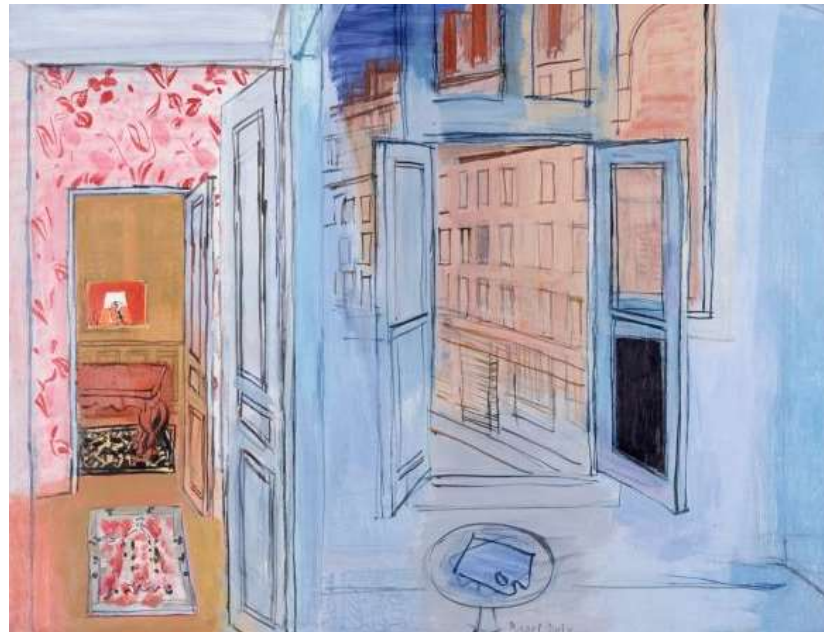
L'Atelier de l'impasse Guelma, 1935-1952

L'atelier se prête en effet à l'allégorie du lieu de création de l'artiste : un espace fermé symbolisant l'autoportrait comme métaphore pour un espace mental où s'accomplit la genèse de l'œuvre. Comme Matisse et Corot, il peint cet espace sans maître, telle une allégorie de la peinture. Ses peintures d'atelier lui permettent aussi de développer le motif de la fenêtre qui forme une interprétation privilégiée de la fusion entre l'intérieur et l'extérieur.