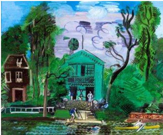
Bords de Marne, les canotiers , 1925 Huile sur toile, 60 x 72,5 cm Paris, Musée d'art Moderne legs du docteur Maurice Girardin, 1953

Dans ses jardins et paysages, Dufy reprend des pratiques du cubisme, par géométrisation et abstraction, et de son expérience de décorateur avec arcades et balustrades qui rythment les espaces. Il travaille ainsi sur un espace redressé à la verticale proche de la planéité, et surtout utilise la juxtaposition de motifs : l'échelle des différents motifs ne correspond pas à leur éloignement.