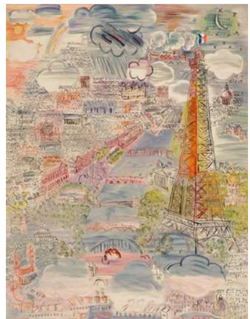
Paris, 1937 Tapisserie laine et soie, licier atelier André Delarbre, 204 x 167,5 cm, Paris, Mnam/CCI, Centre Pompidou, don anonyme, 1967