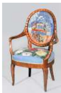
Raoul Dufy et André Groult (1884 - 1966) La Madeleine, 1933 Bois de hêtre, tapisserie de Beauvais Dim. 100 x 55 x 54 cm Paris, mobilier national et manufactures des Gobelins, de Beauvais et de la Savonnerie