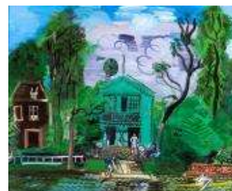
Bords de Marne, les canotiers , vers 1925 Huile sur toile, dim. 59,5 cm x 72,5 cm Paris, Musée d'art Moderne de Paris, legs du Docteur Maurice Girardin, 1953 © Adagp, Paris 2021