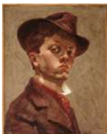
Autoportrait au chapeau mou , vers 1898 Huile sur toile, dim. 41 cm x 33 cm Le Havre, Musée d'Arts modernes André Malraux - MuMa, dépôt du MNAM, Centre Georges Pompidou

Ces conditions sont valables pour les sites internet ayant un statut de presse en ligne étant entendu que pour les publications de presse en ligne, la définition des fichiers est limitée à 400 x 400 pixels et la résolution ne doit pas dépasser 72 DPI.