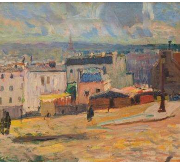
Vue de Paris depuis Montmartre , 1902 Huile sur toile, 45 x 55 cm - Collection particulière

À la fin du XIX e et au début du XX e siècle, le petit monde bohème de Paris se retrouve tous les dimanches après-midi au Moulin de la Galette . Nombreux sont les peintres qui ont immortalisé ce haut-lieu de la vie parisienne, Van Dongen, Renoir, Van Gogh... Raoul Dufy ne pouvait que se laisser séduire.