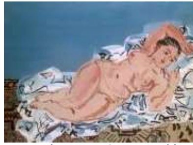
Nu couché , titre attribué : Nu couché à la draperie , 1930 Huile sur toile, 60 cm x 81 cm Paris, Musée d'art Moderne de Paris, legs du Docteur Maurice Girardin, 1953 © Adagp, Paris 2021