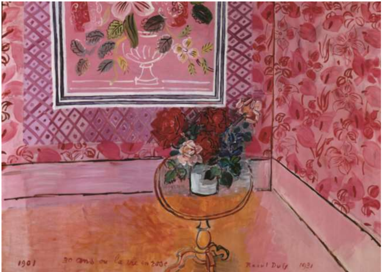
30 ans ou la vie en rose,

Il tente à travers ses séries qu'il réalise d'exprimer une synesthésie entre musique et peinture. À partir de 1946, Dufy adopte en effet, notamment dans ses hommages musicaux, un système de peinture tonale qui couvre l'ensemble de la toile (...). L'impact des couleurs est renforcé par leur place dans l'espace. Sans ombre, chaque objet possède sa couleur et son plan, affranchi de l'éclairage naturel. L'effacement du volume est complété par un rabattement de la perspective sur un seul plan. Les sols des ateliers prolongent les murs.