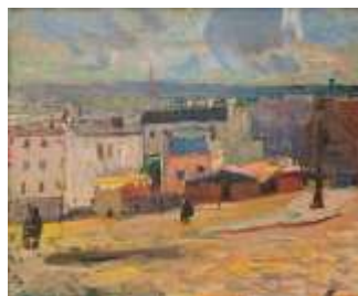
Vue de Paris depuis Montmartre , 1902 Huile sur toile, dim. 45 cm x 55 cm Collection particulière © Adagp, Paris 2021