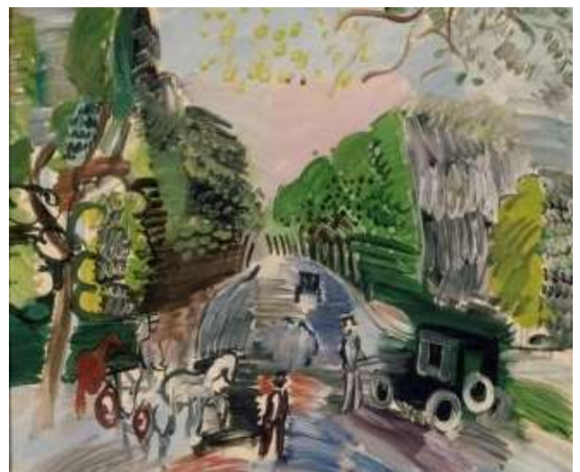
Au bois de Boulogne , 1920 Huile sur toile, 46 x 55 cm Paris, Musée d'art Moderne donation de Henry-Thomas, 1976

Il aime peindre Paris et ses alentours, insistant sur l'élégance des grilles, des allées et des jardins, révélant les architectures au milieu de la verdure. Il y place différentes petites scènes d'une vie insouciant et légère et c'est ainsi qu'il représente le bois de Boulogne, dans des compositions généralement très équilibrées qui se voient troublées par quelque élément en mouvement, comme un oiseau ou un fiacre.