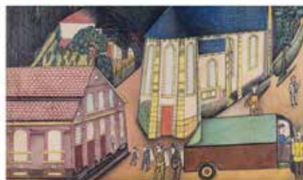
André S. Cavallero (Canyon View) 20 mai 1982 Crayon noir et gouache sur carton et enluminé 50 x 56 cm nr. 2162