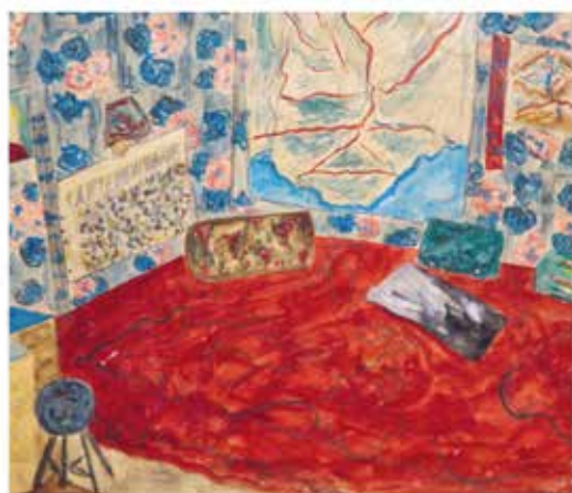
Edouard Manet Chambre (1865) Huile sur toile 20,7 x 25,3 cm Musée d'Orsay