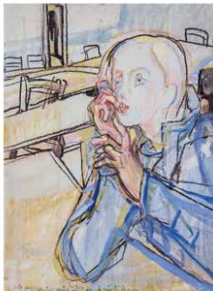
Michel Siffert L'Asile, 1982 Crayon sur papier 20 x 22,5 cm Inv. 1182