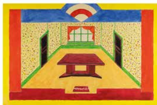
Auguste Herbin Intérieur (1900) Huile sur toile 20 x 47,3 cm Musée d'Orsay