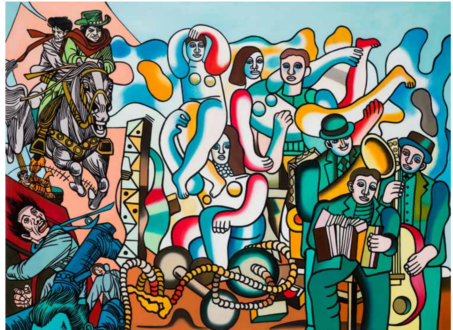
Sans titre - 2020 - Acrylique sur toile - Format : 200x270 cm