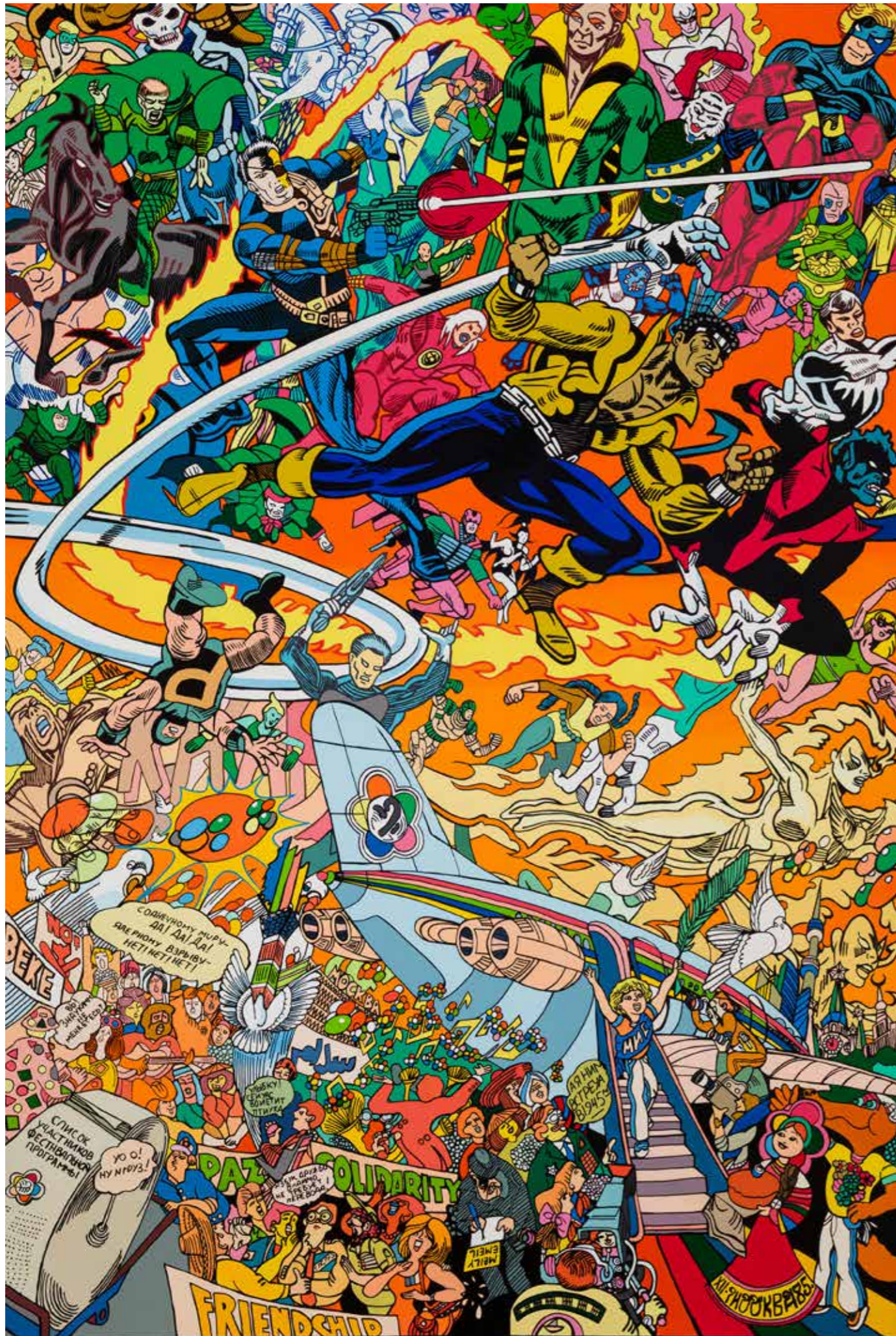
Sans titre - 2020 - Acrylique sur toile - Format : 293x198 cm