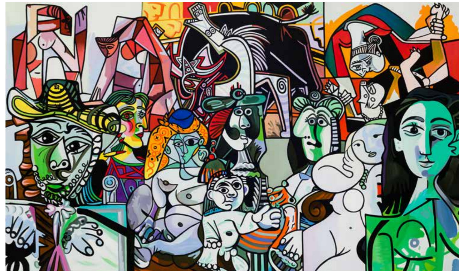
Sans titre - 2020 - Acrylique sur toile - Format : 200x334 cm