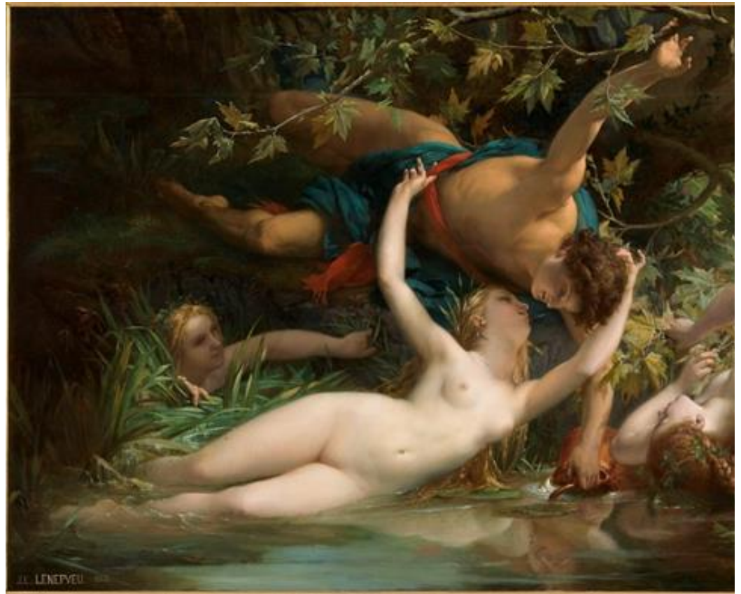
Jules-Eugène Lenepveu, Hylas attiré par les nymphes , 1865, musée des Beaux-Arts d'Angers