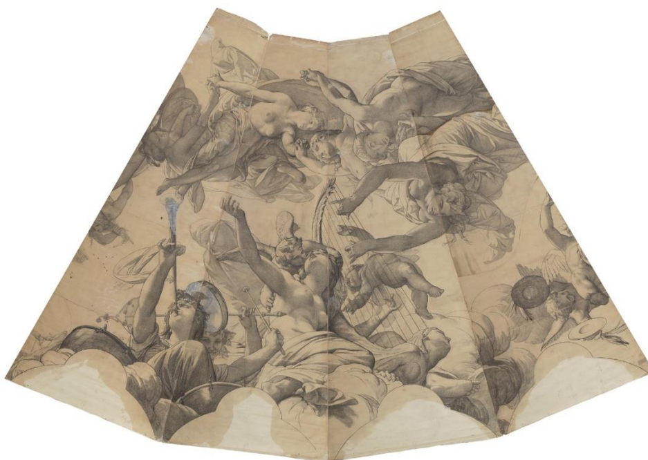
Jules-Eugène Lenepveu, Les Muses et Les Heures , quatre fuseaux assemblés, cartons pour le plafond de l'Opéra de Paris, 1870, musée des Beaux-Arts d'Angers © Albert

Tous les publics, quel que soit leur âge ou leurs aspirations, pourront tout au long de l'exposition bénéficier d'une riche programmation d'événements, conférences et activités.