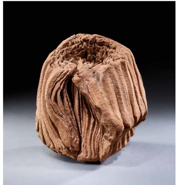
Jacques Kaufmann, Structure érodée , 2001, brique déformée au façonnage et sablée. H. 21 cm.