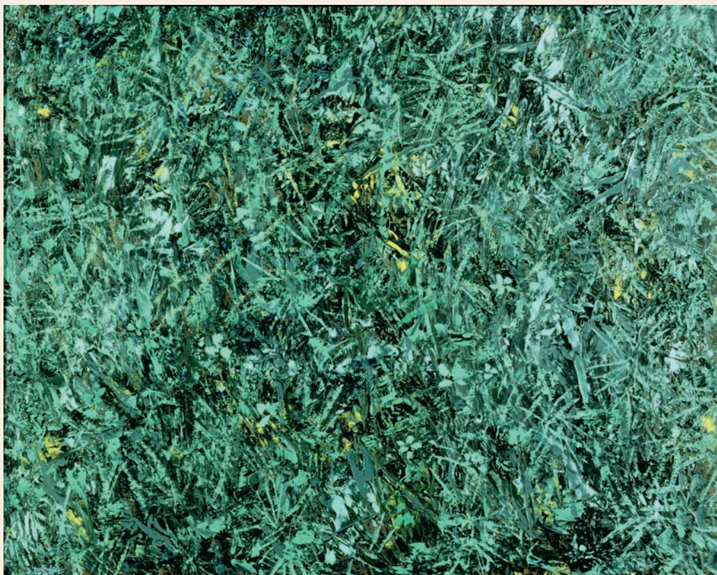
L'herbe , 1954 - huile sur toile 71 x 89 cm. Fondation Dubuffet © Adagp, Paris, 2022