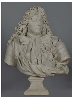
Antoine Coysevox, Louis XIV , roi de France, château de Versailles