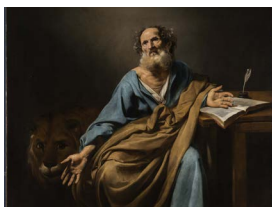
1. Valentin de Boulogne, Saint Luc, évangeliste , château de Versailles © c.Fouin / Dist. RMN 2. Valentin de Boulogne, Le tribut de César , château de Versailles © c.Fouin / Dist. RMN