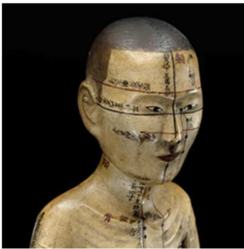
Mannequin d'acupuncture, Chine, 18 e s., Musée Guimet, Paris