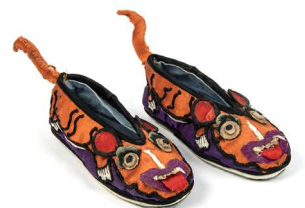
Chaussures protectrices à décor de tigre pour enfant, Chine, 20 e siècle, Musée des Confluences, Lyon, Collection Dautresme