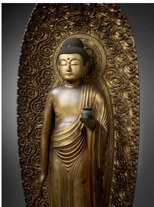
Bouddha de médecine, Japon, 18 e -19 e siècle, Musée Guimet, Paris