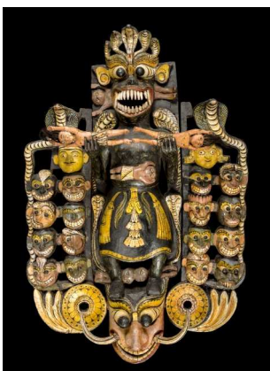
Masque d'exorcisme, Sri Lanka, 19 e siècle, Pitt Rivers Museum, Oxford