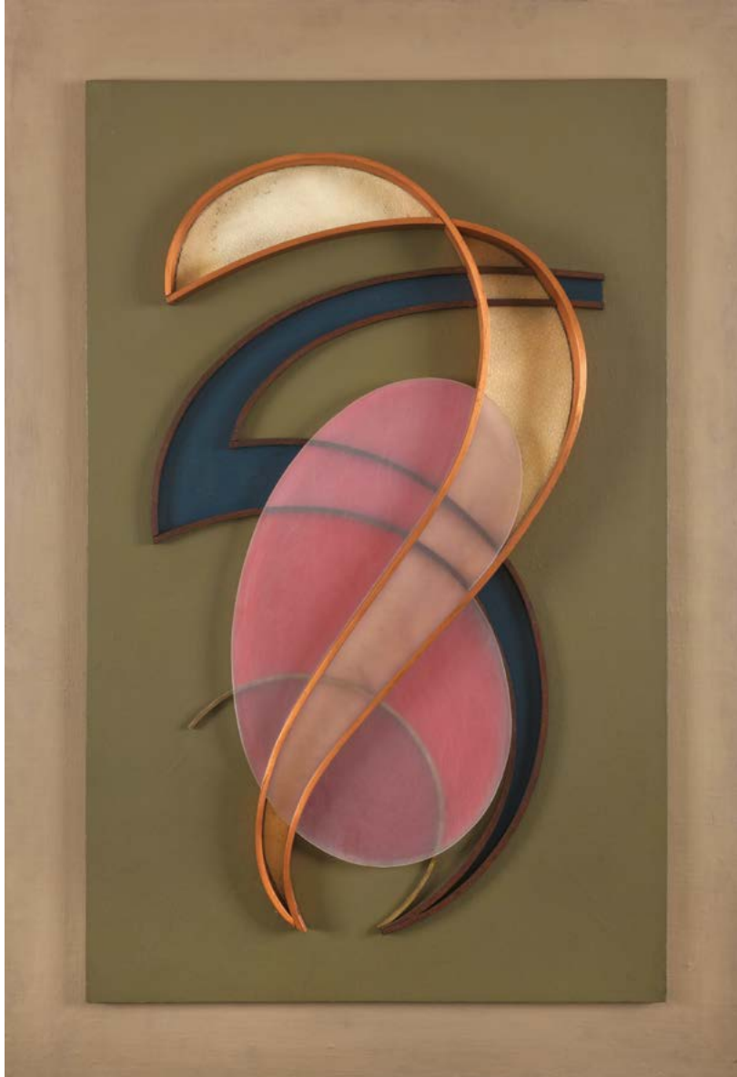
Relief n°66, 1959, peau de requin enfermée par le cuivre sur fond vert, 87 x 55 cm

Notre exposition, composée de plus de 50 pièces dont plusieurs de qualité muséale, embrasse ces différentes périodes de l'œuvre de Domela ainsi que la diversité de supports et de techniques qu'il explorait dans son travail : les photographies, les photomontages, les tableaux, les sculptures, mais surtout les reliefs qui constituent l'aboutissement de ses expérimentations antérieures et l'axe principal de son parcours.