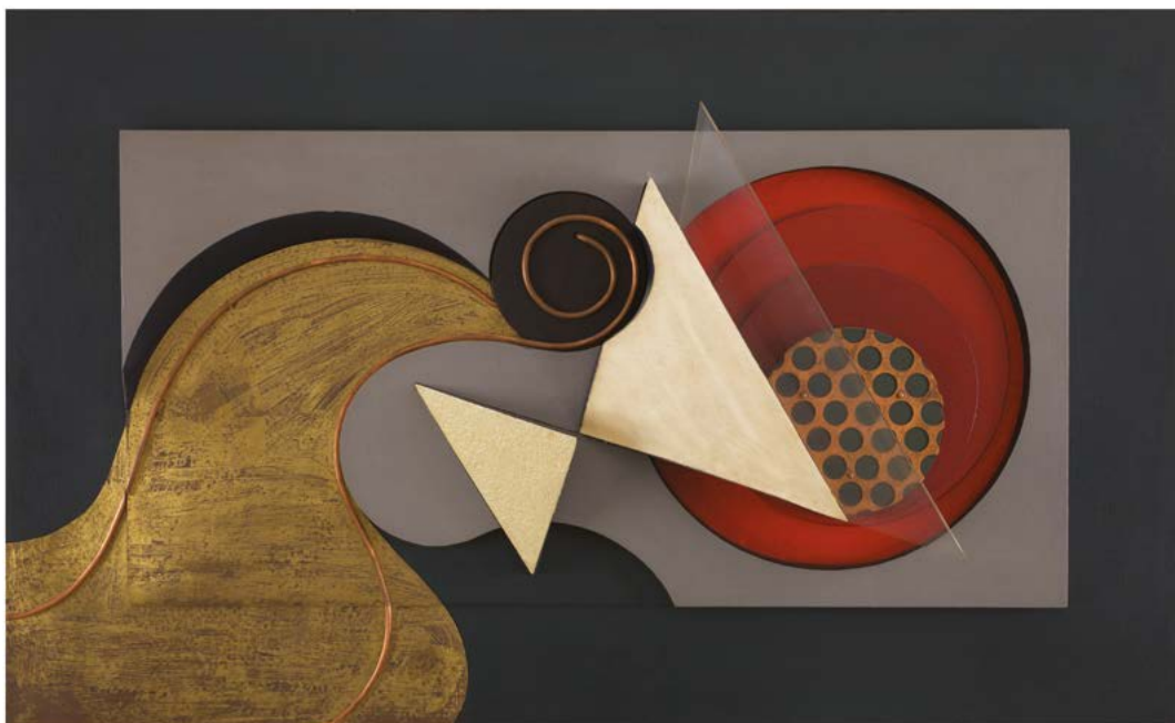
Relief n°15 A , 1939, bois peint, cuivre rouge, peau de requin, parchemin, cuivre, laiton, 60 x 100 cm

Pendant la guerre, alors que l'activité artistique est considérablement réduite à Paris, il est régulièrement présent à la galerie Jeanne Bucher qui crée à l'époque un espace accueillant pour la Deuxième École de Paris en train de naître. Il y expose notamment en février 1944 à côté de Nicolas de Staël et de Wassily Kandinsky. La même année, tous les trois participent également, avec Magnelli, à l'exposition Peintures Abstraites, Compositions de Matières à la Galerie Esquisse.