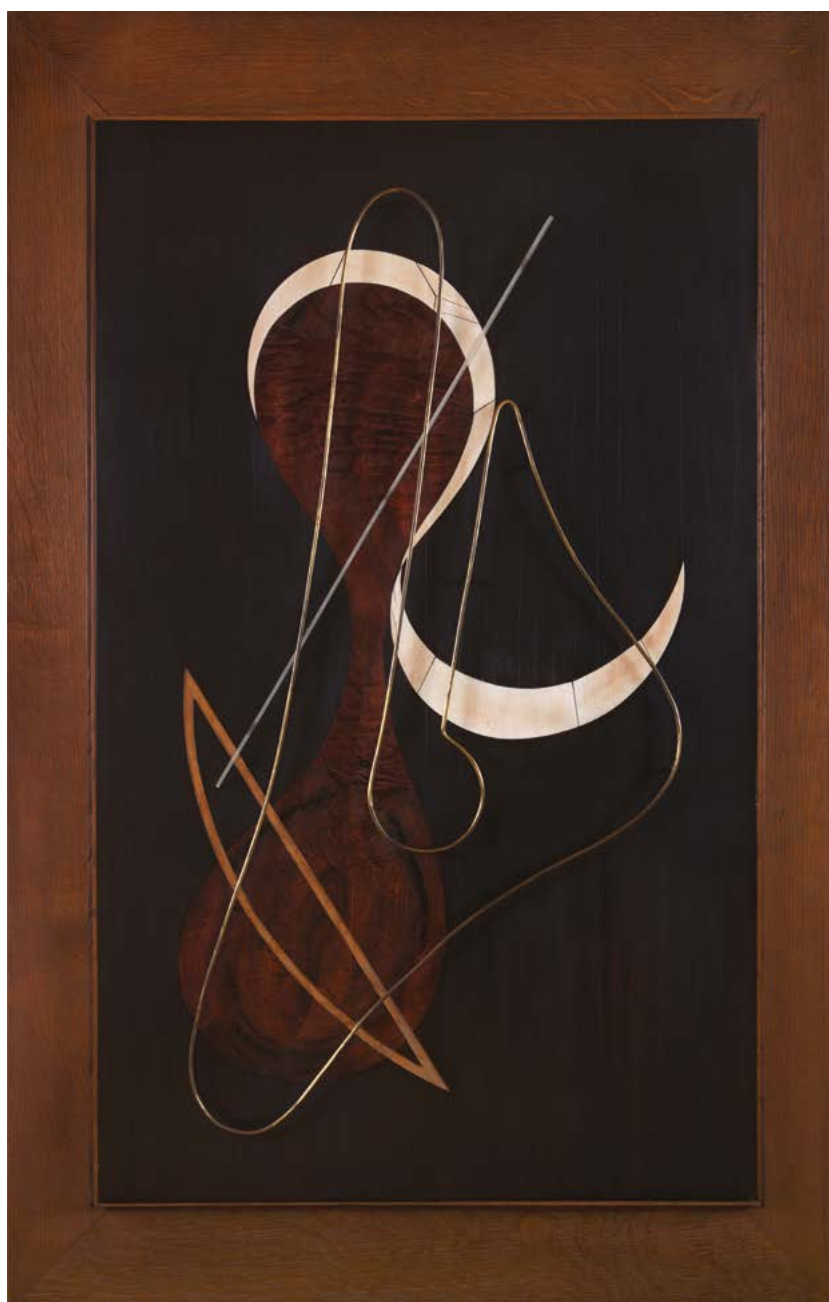
Relief n°19, 1945, ébène, ivoire, laiton, plexiglas, 89 x 55 cm

Après la guerre, la richesse et l'originalité de son travail ne cesseront d'être saluées, autant en France où il réside jusqu'à sa mort en 1992, qu'à l'étranger. Il participe à de nombreux expositions dédiées à l'Art Concret (Galerie Drouin, 1945), De Stijl (Stedelijk Museum, 1951), ainsi qu'à la fondation du Salon des Réalités Nouvelles (à partir de 1946) ; plusieurs rétrospectives lui sont consacrées à Paris (Galerie Denise René, 1947), Londres (Galerie Apollinaire, 1948 ; Annely Juda Fine Art Gallery, 1973), Berlin, Rio de Janeiro et Sao Paulo (1954), Amsterdam (Stedelijk Museum, 1955), New York (Galerie Chalette, 1961), et même Calcutta (1979).