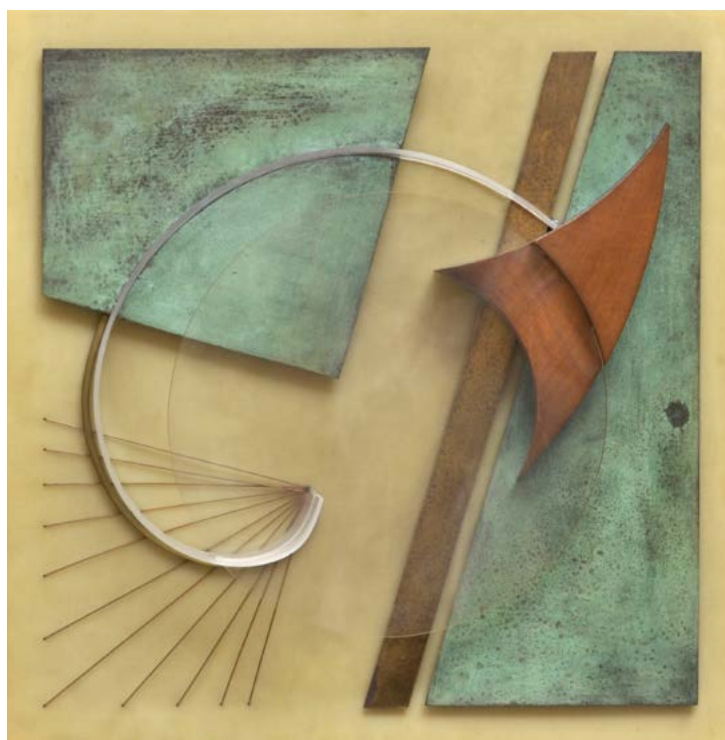
Relief n°13 B. Construction en brun et bleu , 1937, cuivre, laiton oxydé, macassar, plexiglas, 73 x 73 cm