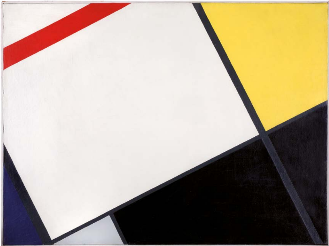
Composition néo-plastique n° 5K, 1926, huile sur toile, 55 x 74 cm

La Galerie Le Minotaure inaugure l'année 2023, ainsi que son nouvel espace du 23 rue de Seine (qui s'ajoute à celui du 2 rue des Beaux-arts), avec une exposition monographique de César Domela (1900-1992), artiste néerlandais qui commence sa carrière dans la première moitié des années 1920 comme membre du groupe De Stijl.