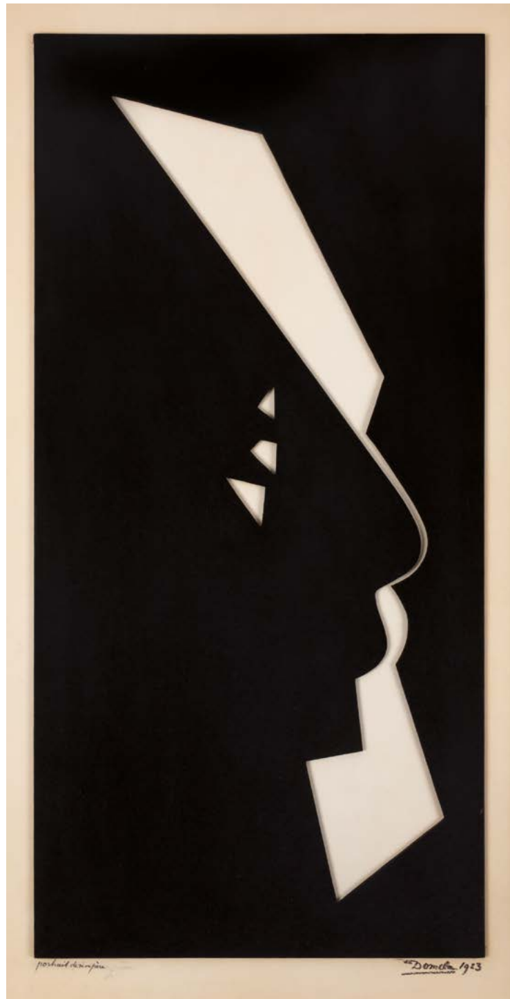
Portrait de mon père , 1923, huile sur masonite découpée sur fond de papier blanc, 75 x 41 cm

Par la suite, il s'éloigne des principes du néoplasticisme et abandonne progressivement la peinture à l'huile pour réaliser des reliefs conciliant géométrie et organicisme, devenant un des maîtres incontestables du genre. Ses compositions de matériaux aussi divers qu'insolites (bois, peau de requin, écailles de tortue, daim, cuivre, laiton, plexiglas...) privilégient des courbes sinueuses, ellipses, cercles, arabesques, autant de formes et motifs puisés dans sa connaissance et sa passion pour la pensée et l'esthétique orientales.