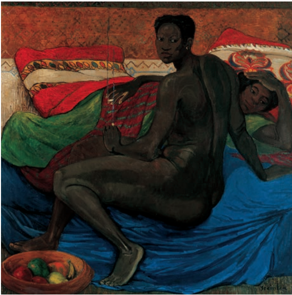
Théophile-Alexandre Steinlen, Détente , 1912 huile sur toile, 151 x 151 cm. Association des Amis du Petit Palais, Genève

Témoin de la Grande Guerre, il cherche des moyens picturaux et graphiques pour représenter l'indicible, et devant l'absurdité de l'histoire humaine, se met au paysage. Il réalise une série de nus, dont ceux de Masséida, une femme d'origine Bambara qui devient le modèle d'œuvres dans lesquelles Steinlen interroge les notions contemporaines d'exotisme, primitivisme et colonialisme. Cette production d'œuvres de genres académiques est à comprendre dans la continuité de ses travaux, portés par le même message social, le même regard humaniste : Steinlen s'inscrit à la suite des maîtres et de la tradition classique dont il détourne les codes iconographiques avec ironie, laissant ainsi deviner en filigrane ses positions antimilitaristes, anticléricales et anticolonialistes.