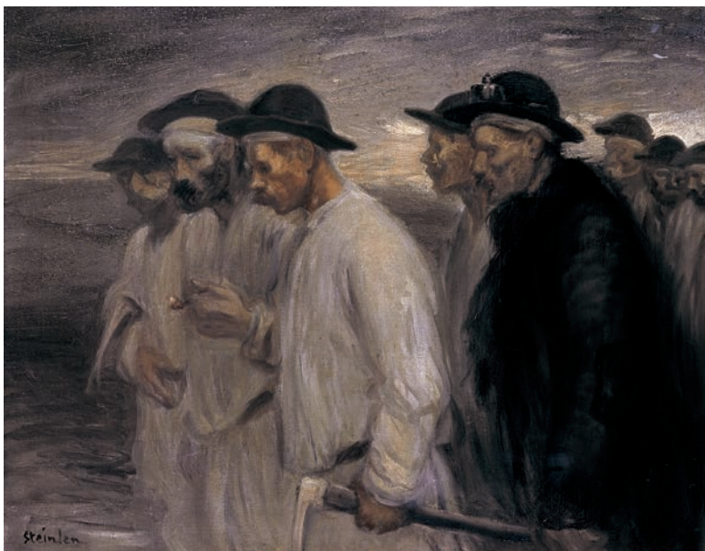
Théophile-Alexandre Steinlen, Les Mineurs , 1903, huile sur toile 65 x 50 cm. Association des Amis du Petit Palais, Genève

Selon un parcours chrono-thématique, l'exposition retrace la carrière de Steinlen et donne un aperçu de la richesse de sa production à travers une sélection d'une centaine d'œuvres, dont une grande proportion de peintures à l'huile, moins connues que son œuvre graphique, largement représentée également dans l'exposition, ainsi que des sculptures. Suivant le fil conducteur de l'art social, le parcours est organisé en trois principaux mouvements : Montmartre et le Chat Noir ; le peuple comme sujet et but de l'art ; enfin, entre peinture d'histoire et nus intimes, le rapport aux genres classiques de l'histoire de l'art, toujours au service d'une vision politique de l'art.