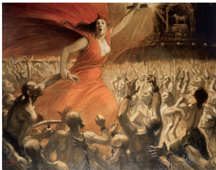
Théophile-Alexandre Steinlen, Le cri des opprimés ou La Libératrice , 1903, huile sur toile 114 x 146 cm. Association des Amis du Petit Palais, Genève

Un fil conducteur se détache au sein de sa production extrêmement prolifique : celui de l'engagement, tant l'artiste associa art et politique, en se faisant témoin critique de son temps. Steinlen fit circuler ses motifs d'une technique et d'un médium à l'autre, entre presse illustrée, art du livre, affiche et tableau. Le peuple des humains, mais aussi celui des chats qui en est comme un double carnavalesque mais à l'irréductible étrangeté animale, sont les principaux sujets de l'artiste qui s'intéressa également aux genres classiques de la peinture, en particulier le nu et le paysage. Méfiant envers toutes les chapelles, Steinlen croyait en la mission sociale et politique de l'art, comme voie et voix vers un monde meilleur.