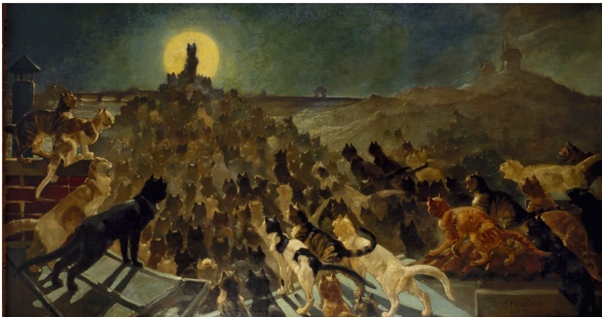
Théophile-Alexandre Steinlen, Apothéose des chats , 1905, huile sur toile, 164,5 x 300 cm