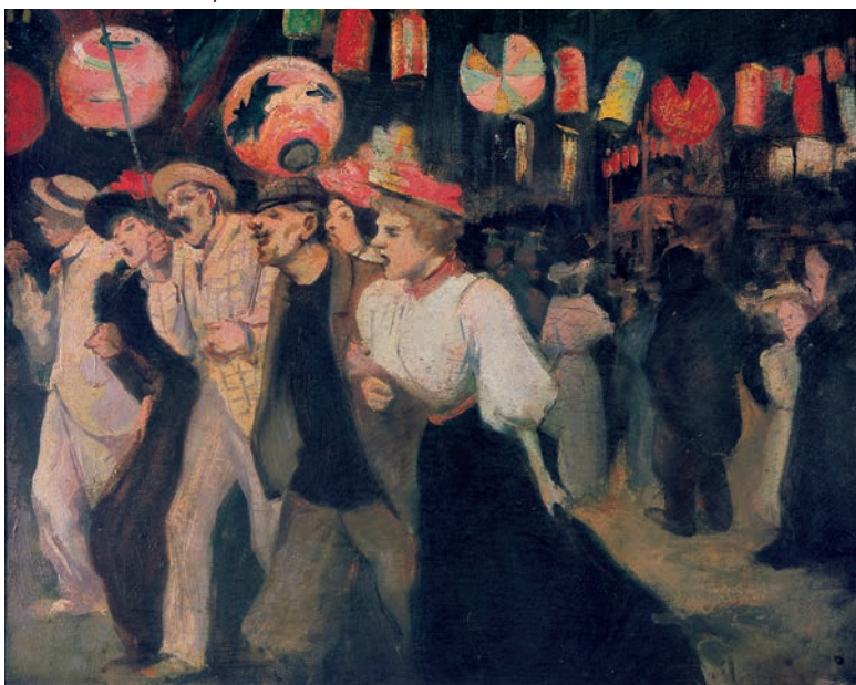
Théophile-Alexandre Steinlen, Le 14 juillet , 1895, huile sur toile 38 x 46 cm. Association des Amis du Petit Palais, Genève

- Le parcours commence avec les œuvres de sa production des premières années parisiennes, liée au cabaret du Chat Noir, déjà empreinte des convictions et de l'engagement de l'artiste : le cercle anarchiste qu'il rejoint éveille chez Steinlen son intérêt social et politique. La figure du chat qu'il déploie dans cet environnement apparaît déjà comme un symbole de liberté et l'emblème des marginaux. Elle témoigne des réflexions de Steinlen sur les agissements des hommes et les rapports de domination, tout comme sa production massive d'illustrations pour des revues aux positions politiques souvent radicales.