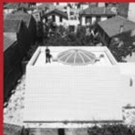
TIRA - MASTABA I