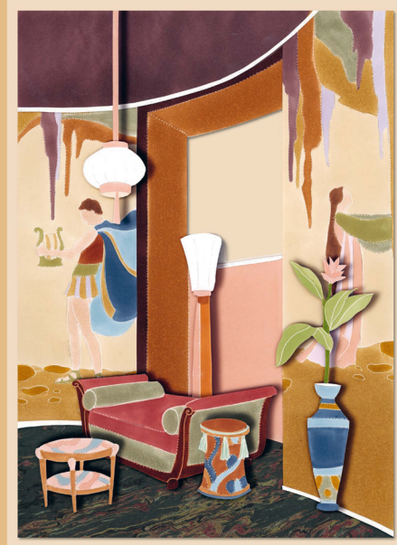
Illustration sur la méridienne Dessiné, collé, découpé, gravé sur papier, 2012 H. 52 cm x L. 20 cm

Prenons l'air Prenons l'eau Prenons le soleil Prenons la mer Prenons la mouche Prenons le temps Prenons racine Rendons hommage