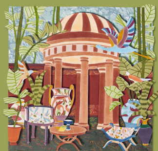
Victor Cadene, collages, Paris, gravure sur papier, 2012 N° 27/10 - 12, 20 cm

Tout est à sa place La vie, l'eau courante