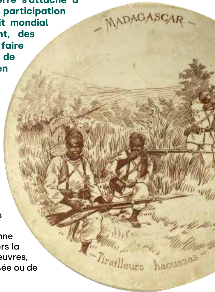
Assiette historiée "MADAGASCAR" représentant des tirailleurs haoussas Utzschneider & Cie, Manufacture de Sarreguemines Entre 1881 et 1919 France

L'exposition « Combattre loin de chez soi, l'Empire colonial français dans la Grande Guerre » que présente le musée de la Grande Guerre adopte une position mesurée, rigoureuse qui s'inscrit dans la continuité de sa collection permanente, bâtie sur les aspects sociétaux et militaires de la Grande Guerre. Dans une approche pluridisciplinaire, l'exposition donne à comprendre les enjeux des récits historiques à travers la présentation de figures, de données scientifiques, d'œuvres, de documents et d'objets issus des collections du musée ou de celles de partenaires institutionnels.