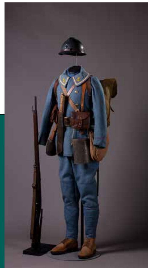
Tirailleur sénégalais en uniforme bleu horizon