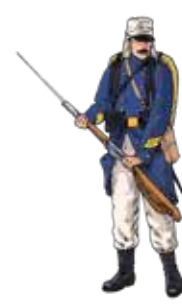
Infanterie légère d'Afrique