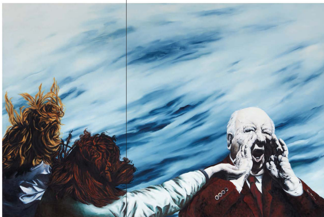
Le ciel aurait le char de poule s'il savait les choses que nous ignorons 2006, huile sur toile 120 x 192,5 cm