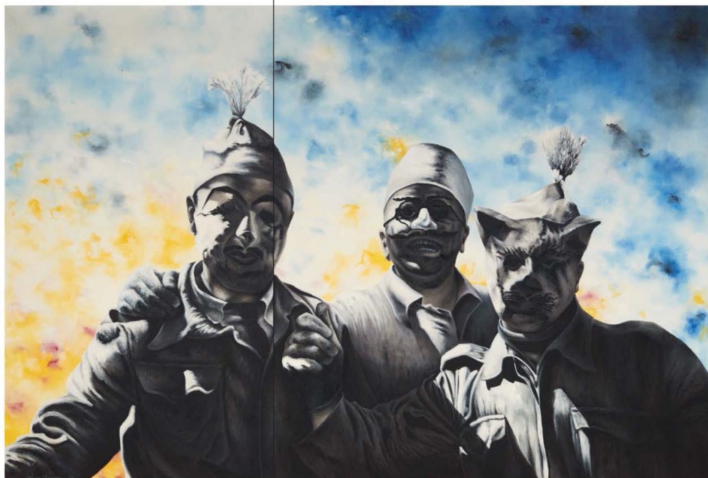
Bon, essayez vous et pleurez f 2010, huile sur toile 131 x 195,5 cm