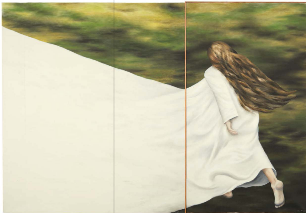
Célestine 2016, huile sur toile 152,5 x 120,5 et 152,5 x 86 cm