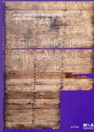
Le Plancher de Jeannot, Catalogue, Jean Crampilh-Brouca- ret, 2024