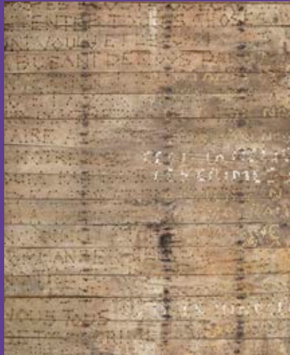
Jean Crampilh-Broucayet, Le Plancher de Jeannot , section 1 dite « grande section », 1971, gravure à la perceuse et au couteau à bois sur lattes de plancher en bois de chêne, 16m 2 , inv. 1777