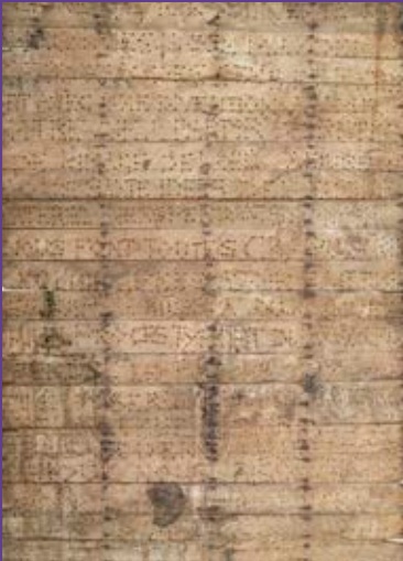
Jean Crampilh-Broucayet, Le Plancher de Jeannot , section 1 dite « grande section », 1971, gravure à la perceuse et au couteau à bois sur lattes de plancher en bois de chêne, 16m 2 , inv. 1777