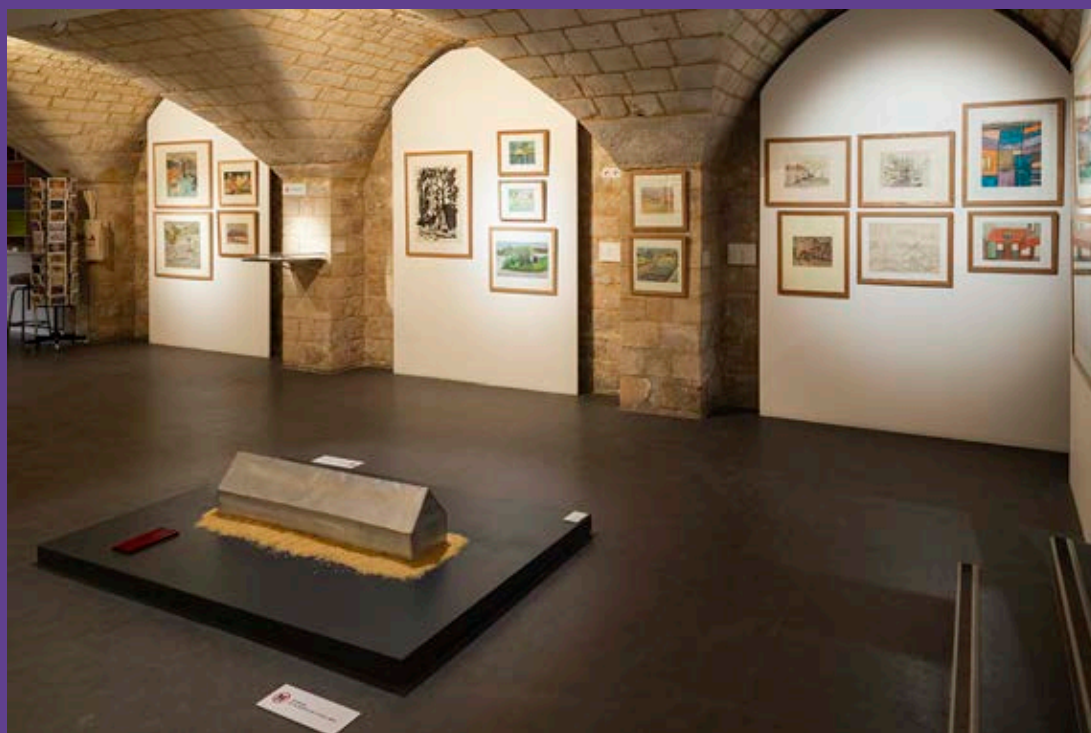
Salle d'exposition, exposition Maisons, 2021-2022

2021 : Diffusion en ligne de l'intégralité de la Collection Sainte-Anne sur la plateforme Navigart, accessible via le site internet du musée.