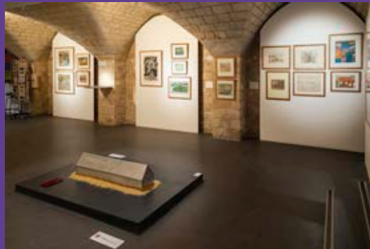
Salle d'exposition, exposition Maisons, 2021-2022