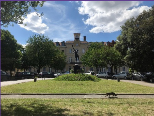
Vue jardin, Musée d'Art et d'Histoire de l'Hôpital Sainte-Anne