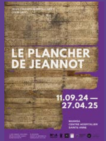
Le Plancher de Jeannot, Affiche © CEE-MAHNSA Mathilde Dubois