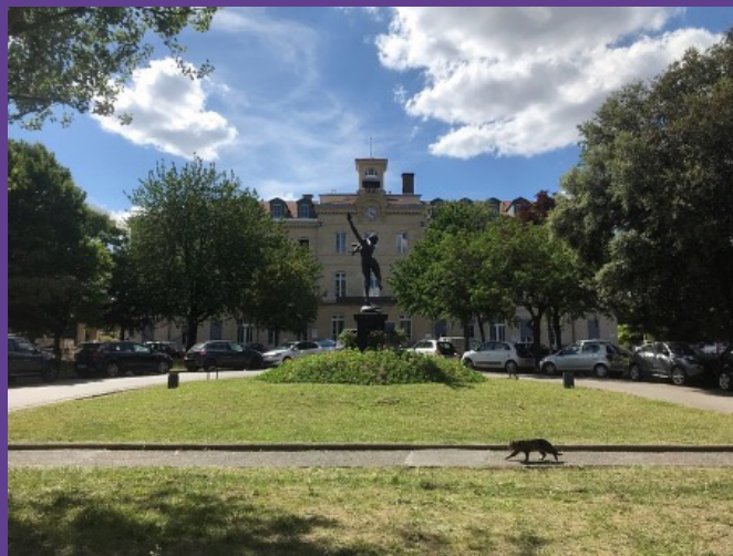
Vue jardin, Musée d'Art et d'Histoire de l'Hôpital Sainte-Anne