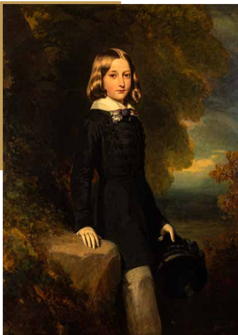
Franz Xaver Winterhalter Léopold, duc de Brabant 1844, huile sur toile, H. 142 cm ; L. 101 cm Belgique, Collection royale, inv. 0107(1)TA