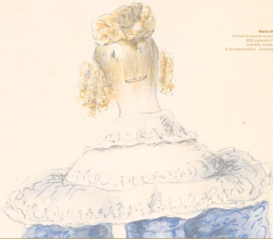
Marie d'Orléans Portrait en pied de la princesse Louise vue de dos 1832, aquarelle, H. 17 cm ; L. 9 cm Chantilly, musée Condé, PD 505