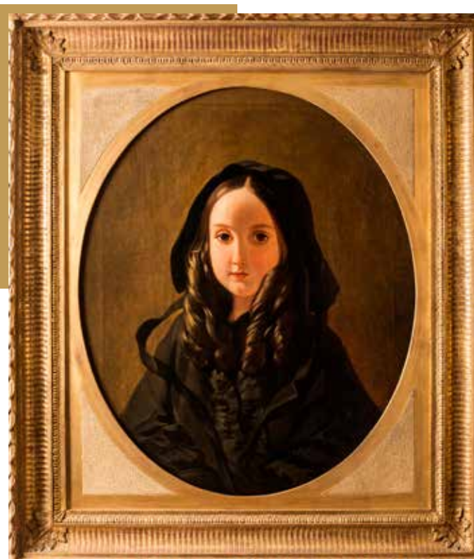
Atelier Franz Xaver Winterhalter Charlotte de Belgique Vers 1844, huile sur toile, H. 63 cm ; L. 71 cm Bruxelles, musée BELvue, fonds musée de la Dynastie, inv. A2200