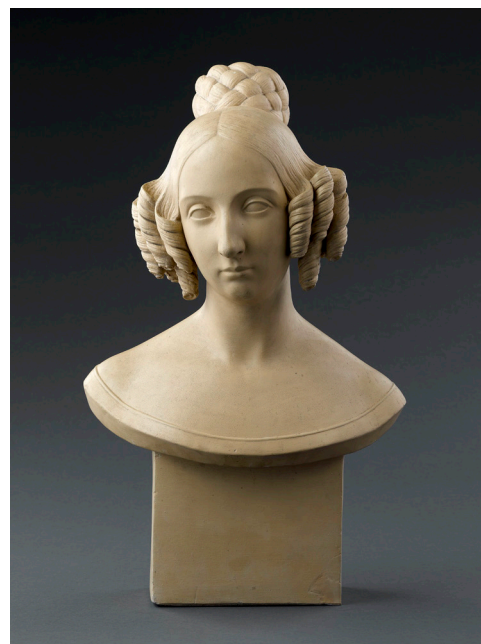
Marie d'Orléans, Buste de Louise d'Orléans, reine des Belges, musée Condé

Le Service des Musées et du Patrimoine culturel a pour mission de sauvegarder, mettre en valeur et développer le patrimoine culturel de la Province de Namur, qu'il soit mobilier ou immobilier, matériel ou immatériel. Le service, outre une cellule chargée de faire rayonner ce patrimoine culturel sur l'ensemble du territoire provincial et au travers des sites patrimoniaux de toutes les communes, comprend deux musées de renommée internationale : le TreM.a musée des Arts anciens, qui expose et valorise des collections de la fin du Moyen Âge et du début de la Renaissance (dont le célèbre Trésor d'Oignies), et le musée Félicien Rops, musée monographique qui met en lumière l'histoire et les artistes belges du XIX e siècle.