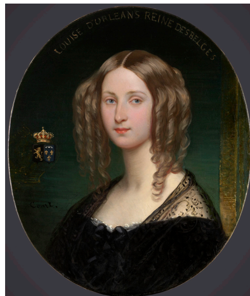
Joseph Désiré Court, Portrait de la princesse Louise d'Orléans, reine des Belges , musée Condé

L'exposition consacrée à cette figure féminine méconnue la remettra à l'honneur auprès d'un large public, autant en France qu'en Belgique, grâce à un partenariat transfrontalier exceptionnel faisant sortir des réserves de véritables chefs-d'œuvre très souvent inconnus, issus de prestigieuses collections, notamment celle de la Collection Royale de Belgique.