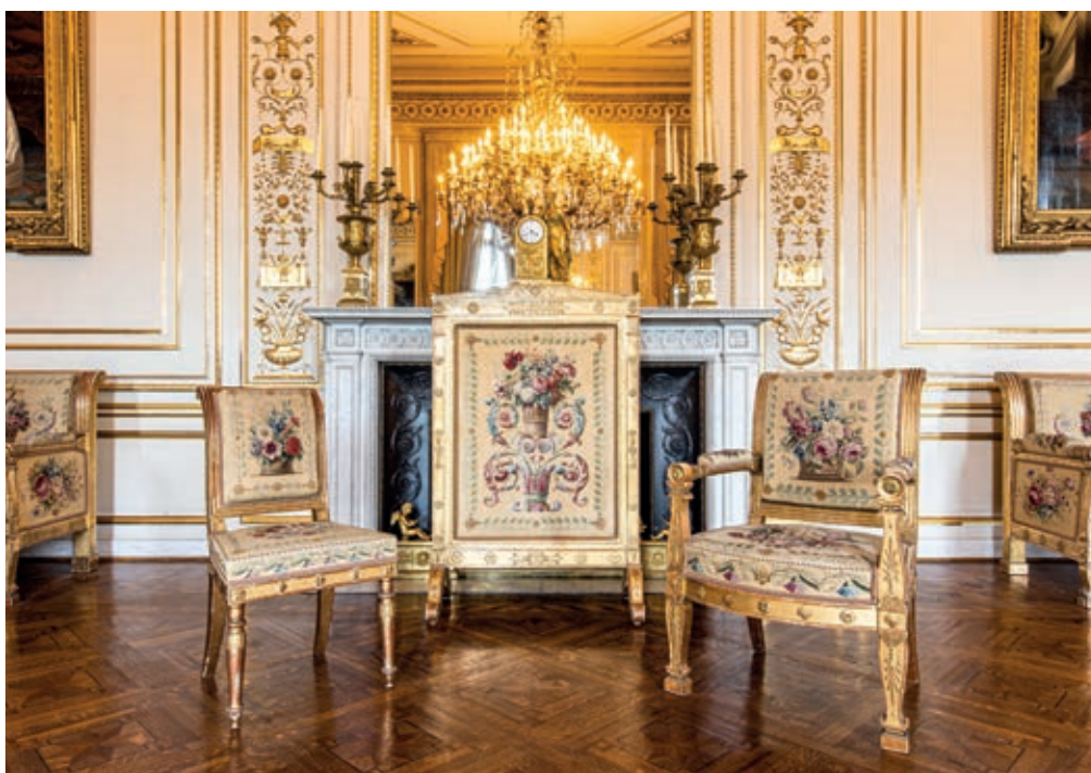
Fauteuil des Salons blancs du Palais royal de Bruxelles h. 96 cm; l. 64 cm; prof. 73 cm Belgique, Collection royale, inv. P0336

Alors que quitter sa famille fut un véritable déchirement pour Louise d'Orléans, la jeune souveraine prit dès les premiers jours fait et cause pour cette nouvelle Nation qu'elle commençait à découvrir. Sans être une femme de pouvoir, elle montra rapidement tous les talents d'une femme politique avisée, construisant une fonction inédite: celle de première reine des Belges.