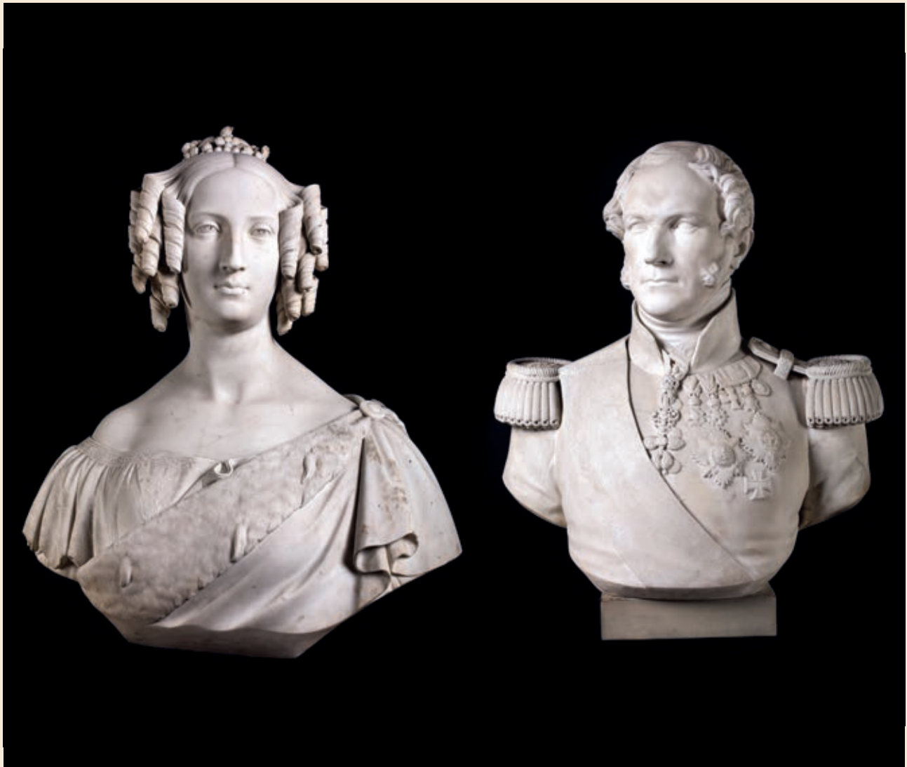
Guillaume Geefs Buste de la reine Louise 1857

Marbre, Namur, collection provinciale, inv. P150