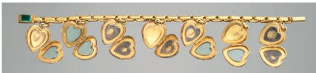
Bracelet aux pendants en forme de cœur Or et gemmes, l. 17,5 cm Chantilly, musée Condé, 2024.5.1

Les recherches extensives menées en préparation de cette exposition et de son catalogue livrent d'elle un tout autre visage. Ayant bénéficié d'une solide éducation artistique, férue de politique et épistolière prolifique, la reine des Belges s'inscrit au cœur d'un large réseau de mécènes avertis et de monarques avisés, tout en témoignant de préférences tout à fait personnelles et en tenant une place à part dans les relations diplomatiques. De nombreuses œuvres inédites venant de sa collection sont pour la première fois présentées, ainsi que d'émouvants souvenirs, mais aussi des représentations officielles ou intimes souvent méconnues, bien qu'exécutées par les plus grands artistes du temps. Il était naturel qu'un partenariat belgo-français soit établi pour valoriser cette figure: le Service des Musées et du Patrimoine culturel de la Province de Namur, province où Louise aimait se rendre, et le musée Condé du Château de Chantilly, où la collection réunie par l'un des frères de la reine, le duc d'Aumale, comporte nombre d'œuvres la concernant, ont eu plaisir à collaborer pour que le destin romantique de Louise d'Orléans, première reine des Belges, puisse être partagé.