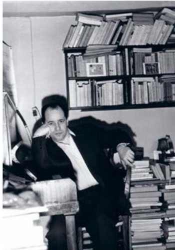
Pierre Boulez dans son appartement parisien, février 1958