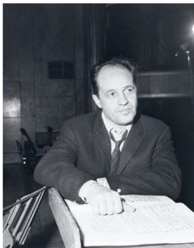
Pierre Boulez en répétition au Théâtre des Champs-Élysées Concert de l'Orchestre de la Société des Concerts du Conservatoire, 28 janvier 1966