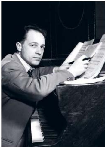
Pierre Boulez, in des années 50

ou presse@infine-editions.fr www.infine-editions.fr