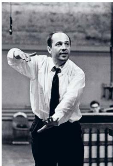
Pierre Boulez dirigeant une répétition du Sacre du printemps avec l'Orchestre de Radio-Canada à Montréal, juin 1963

Mais, d'abord, les répétitions. C'est ainsi que j'ai appris à connaître ce qu'est un orchestre individuellement parlant. L'équilibre des groupes instrumentaux, leur homogénéité, le caractère de chaque instrument solo, je devrais dire de chaque instrumentiste, estimer la correspondance des gestes de direction avec la qualité de la sonorité obtenue, et bien d'autres choses encore, comme le phrasé rythmique, la souplesse ou la régularité de ce phrasé, tout cela, j'e l'ai appris en suivant les répétitions, et même sans que j'en ai vraiment pris conscience sur le moment. Je m'en suis rendu compte lorsque j'ai moi-même commencé à diriger.