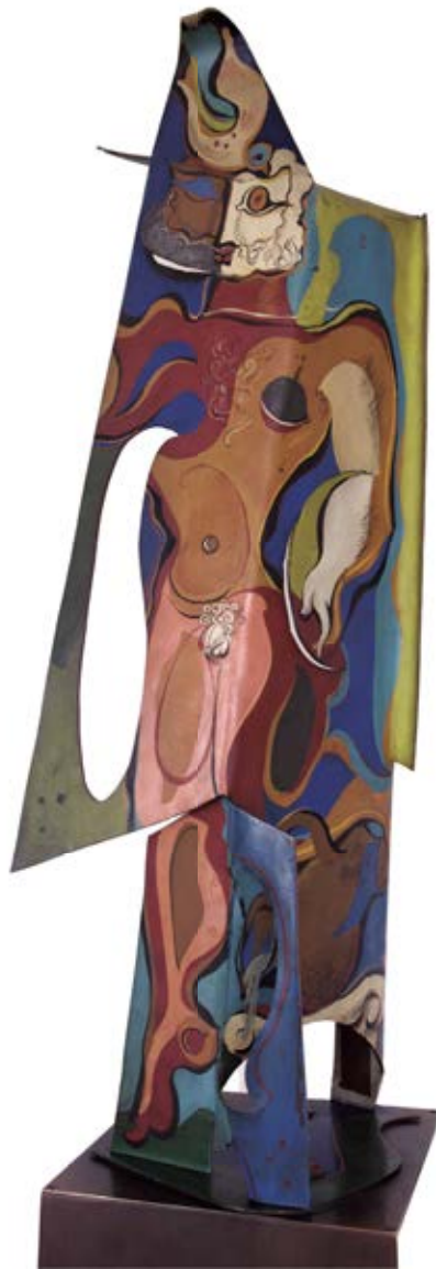
Peinture dans l'espace, 1929, huile sur cuivre, 210 cm

Le dimensionisme, faisant lien avec les récentes découvertes dans les sciences (notamment la théorie de la relativité d'Albert Einstein), souhaitait répondre à une sorte d' « inflation dimensionnelle » observable au début du XXe siècle dans les arts qui cherchaient à se libérer de leur format donné pour conquérir à la dimension suivante (la poésie « quittant la ligne » pour englober le plan pictural, la peinture bidimensionnelle ajoutant une troisième dimension de profondeur pour entrer dans l'espace, et la sculpture incorporant le mouvement pour occuper la quatrième dimension de l'espace-temps). Son manifeste, publié pour la première fois en 1936 aux Editions José Corti à Paris, fut signé par les artistes tels que Wassily Kandinsky, Sonia & Robert Delaunay, Jean Arp, Sophie Taeuber-Arp, Marcel Duchamp, Laszlo Moholy-Nagy, César Domela et aussi Ervand Kotchar.