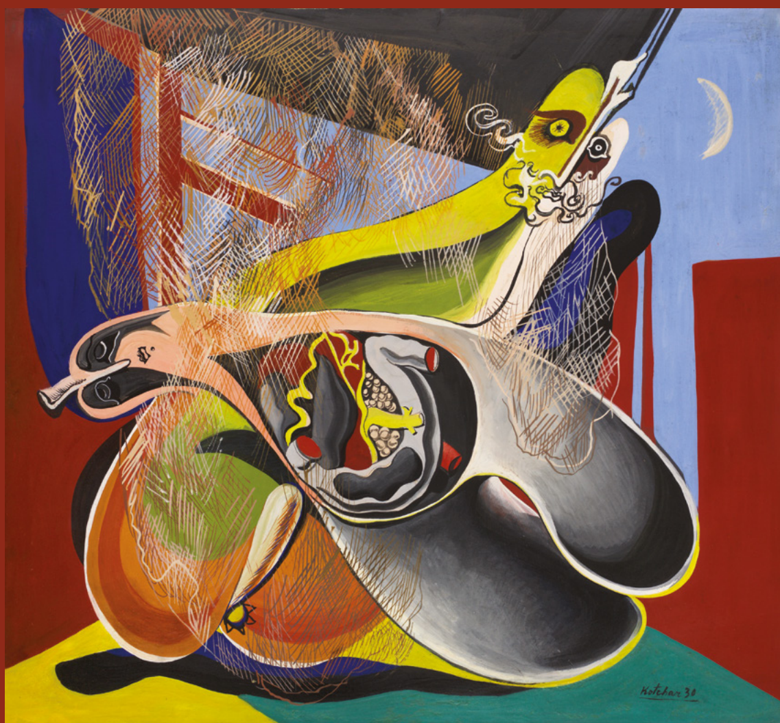
Sans titre , 1930, gouache sur papier, 48 x 52 cm

DE LA PEINTURE DANS L'ESPACE AU DIMENSIONNISME