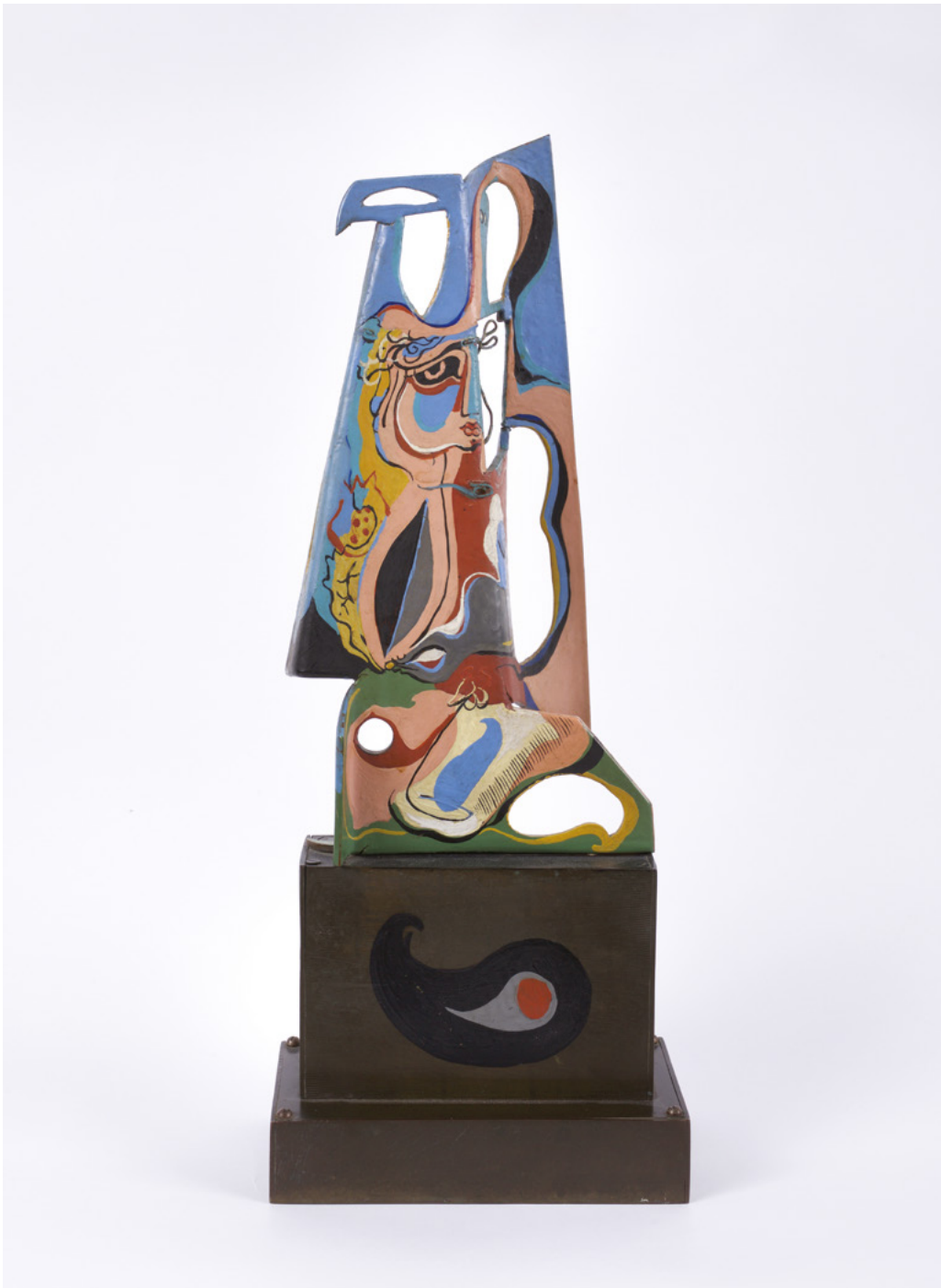
Peinture dans l'espace, 1929, huile sur métal et bois, 37.5 cm

Cette manifestation sera divisée en deux sections. La première présentera le travail d'Ervand Kotchar et notamment ses « peintures dans l'espace » réalisées dans les années 1928-34, qui constituent son apport majeur dans l'art moderne de la période de l'entre-deux-guerres. Avec ses peintures dans l'espace, défendues par le grand marchand des cubistes Léonce Rosenberg et le critique Waldemar George, Kotchar aspirait à délivrer la peinture traditionnelle des deux dimensions, l'arracher à la surface unique pour la placer dans l'espace, s'inscrivant ainsi dans les principes du dimensionnisme auquel sera consacrée la deuxième partie de l'exposition.