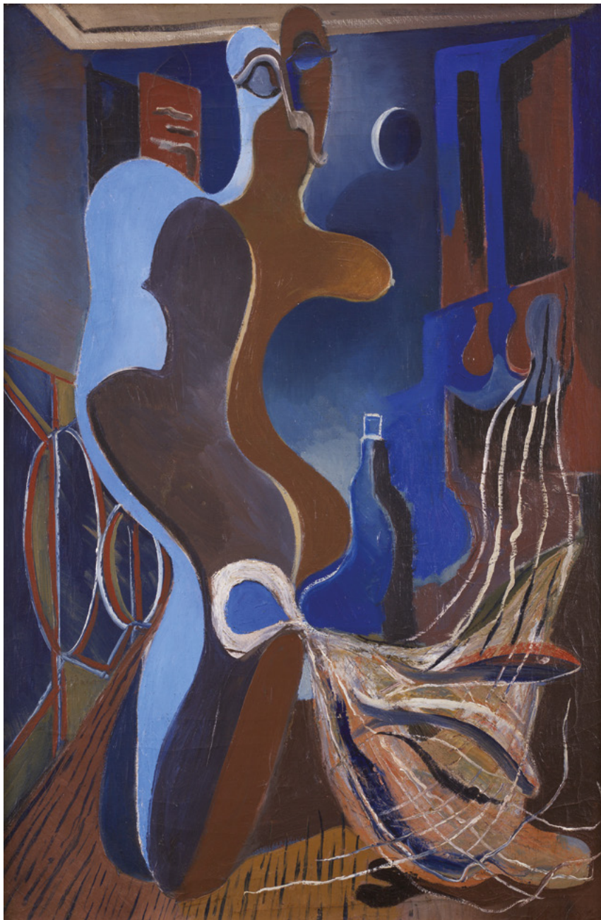
Sans titre , 1929, huile sur toile, 80 x 53 cm

Pour inaugurer l'année 2025, la Galerie Le Minotaure prépare une exposition consacrée à l'artiste arménien Ervand Kotchar et au dimensionisme, mouvement lancé au milieu des années 1930 par le philosophe d'art hongrois Charles Sirato dont Kotchar a signé le manifeste. Cette exposition se tiendra du 15 février au 15 avril 2025 et sera organisée en collaboration étroite avec le Musée Ervand Kotchar et la famille de l'artiste qui ont mis à notre disposition leurs archives constituant la base de l'exposition et de la publication qui l'accompagnera.